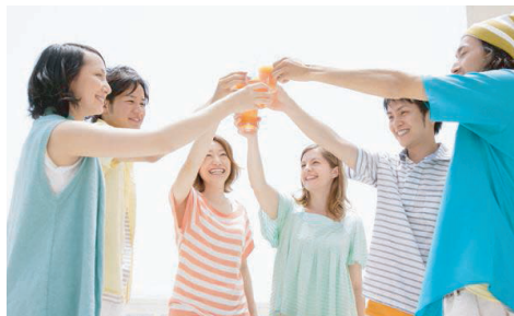
秋の味覚を味わいながらパーティーを満喫!