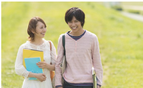
ウォークラリーしながらのトークタイム